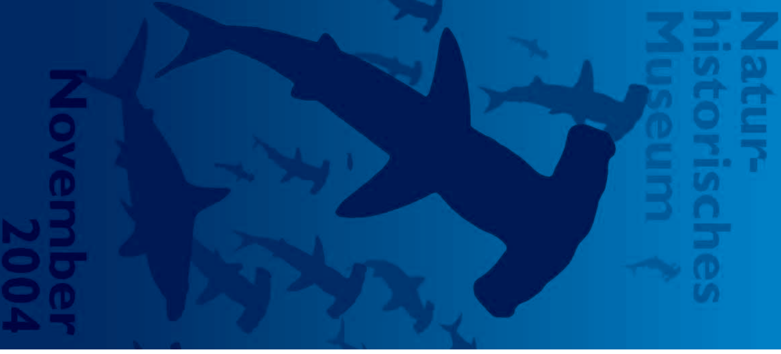
Titelbild: Hammerhaie – Ausschnitt aus den neu gestalteten Fensterbildern im Haisaal; Banner: Exotische Früchte