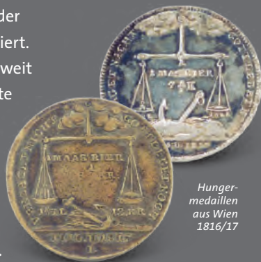
Hungermedaillen aus Wien 1816/17

Die Explosion des Vulkans Taupo auf Neuseeland, ca. 178 n. Chr., kann als bedeutender Einschnitt des europäischen Klimas archäologisch nachgewiesen werden. Ebenso ist der Ausbruch des Tambora in Indonesien für die Zeit von 1815–1850 als einschneidender Einbruch für das europäische Klima der Biedermeierzeit dokumentiert. Es stellt sich die Frage, wie weit die derzeit heftig diskutierte „Klimaerwärmung“ andauern wird, bedenkt man das geologische Risiko eines Mega-ausbruchs eines Vulkans am anderen Ende der Welt.