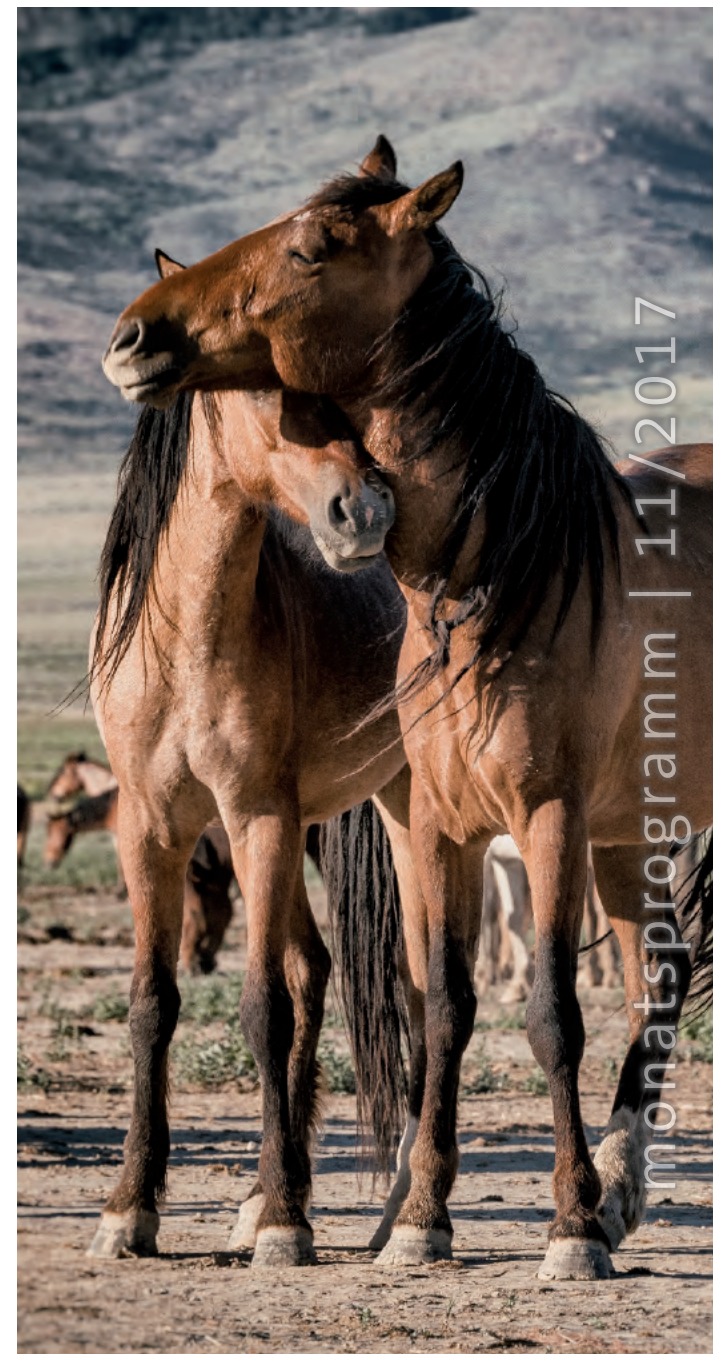
Mustangs – Fotografien von Manfred Baumann, zu sehen ab 22. November im Saal 50

Sa, 18. und So, 19. sowie Sa, 25. und So, 26. November: Aus der Wunderwelt der Insekten