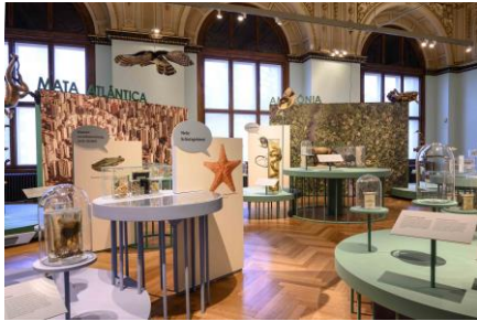
Saal 18 Saalansicht