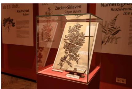
Kabinett 3 Brasilholz