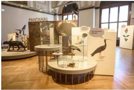
Saal 17 Pantanal