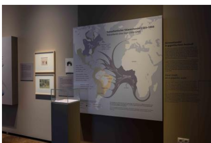
Kabinett 4 Saalansicht