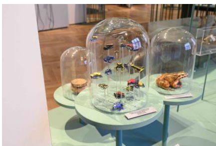
Saal 18 Detail mit Pfeilgiftfröschen