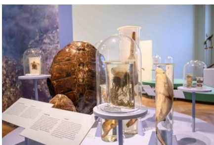
Saal 18 Bioma Marinho