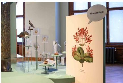
Saal 18 Amazônia