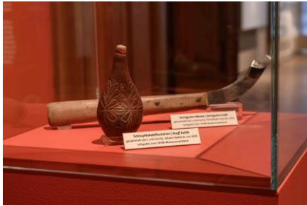
Kabinett 3 Schnupftabakfläschchen und Seringueiro-Messer