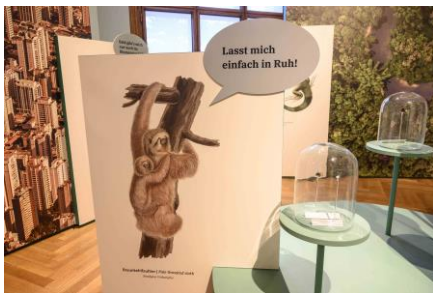
Saal 18 Braunkehlfaultier