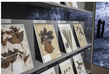
Kabinett 4 Herbarbelege