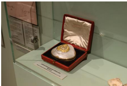
Kabinett 2 Polierte Körbchenmuschel