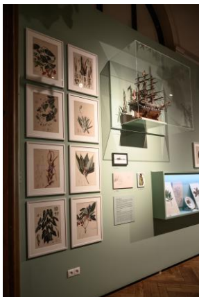
Kabinett 2 Saalansicht