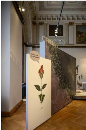
Saal 17 Cerrado