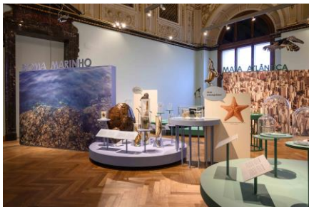
Saal 18 Saalansicht