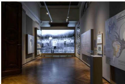
Kabinett 4 Saalansicht