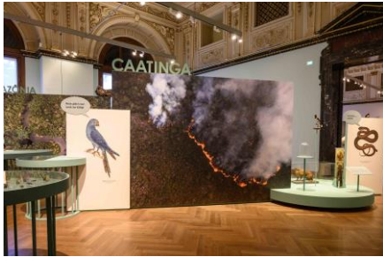
Saal 18 Caatinga