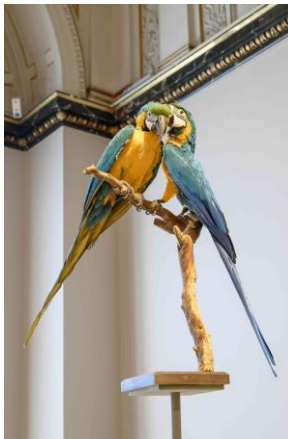
Saal 17 Detail mit Ara-Präparaten