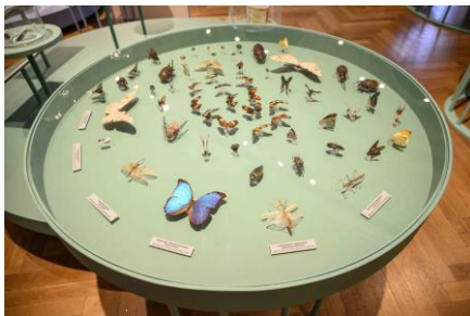
Saal 18 Vitrine mit verschiedenen Arten