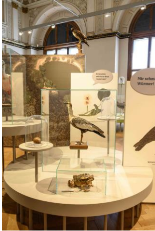
Saal 17 Pantanal