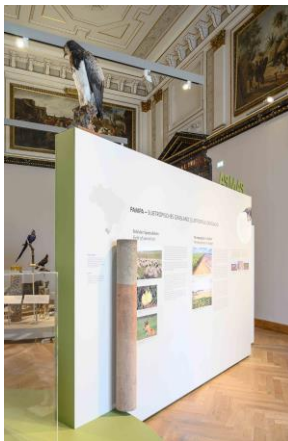
Saal 17 Pampa