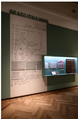
Kabinett 2 Saalansicht