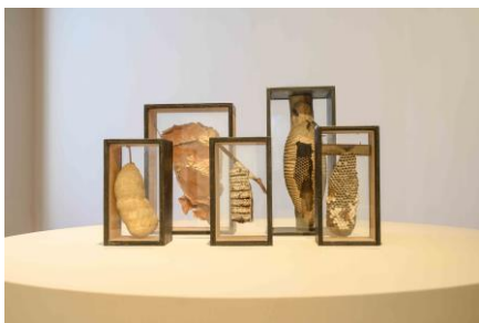
Saal 17 Cerrado