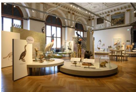
Saal 17 Saalansicht