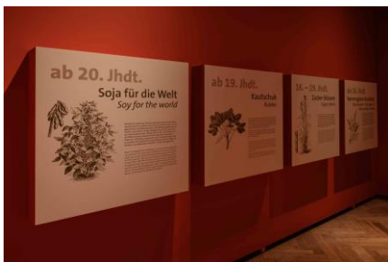
Kabinett 3 Saalansicht