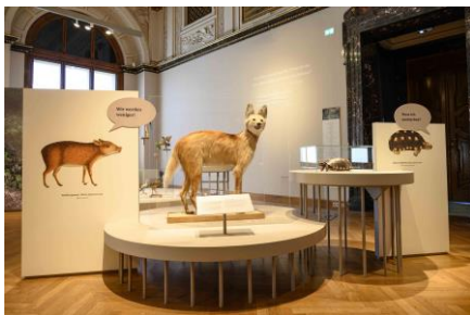
Saal 17 Cerrado