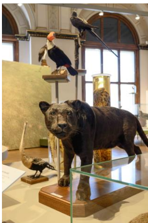
Saal 17 Saalansicht