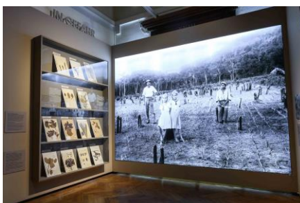
Kabinett 4 Saalansicht