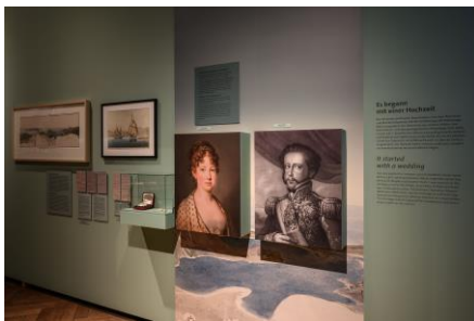
Kabinett 2 Saalansicht Erzherzogin Leopoldine (Joseph Kreutzinger, um 1815) und Dom Pedro von Portugal (Gianni, vor 1830)