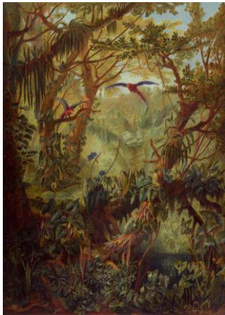
Ausstellungssujet Frontispiz von Joseph Selleny, 1879