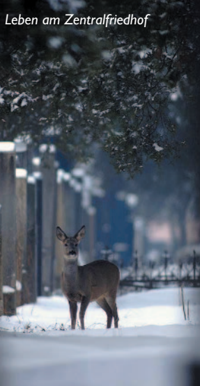
Leben am Zentralfriedhof