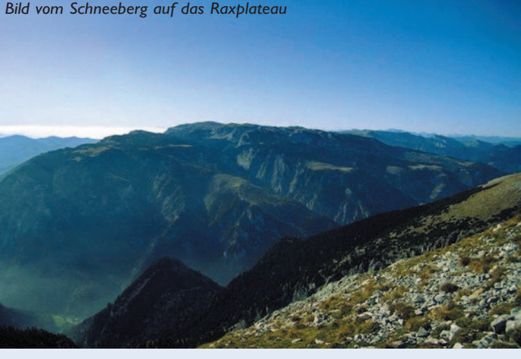
Bild vom Schneeberg auf das Raxplateau

Eine Veranstaltung der ArGr. Karst&Höhle OEAV am NHM Die umfangreichen aktuellen karst- und höhlenkundlichen Forschungsergebnisse sowie die karsthydrogeologischen Erkenntnisse der letzten Jahrzehnte rechtfertigen die Frage nach den Gemeinsamkeiten bzw. den Unterschieden der Karstmassive in den östlichen Kalkhochalpen – zwischen Gesäuse und Schneeberg. Die Interpretation geologischer, speläologischer, geomorphologischer und hydrogeologischer Faktoren. Die KHA wird ihre Daten in die Diskussion mit dem Publikum einbringen. Daraus könnten sich neue Erkenntnisse und Ideen zur komplexen Entstehungsgeschichte dieser faszinierenden Gebiete entwickeln.