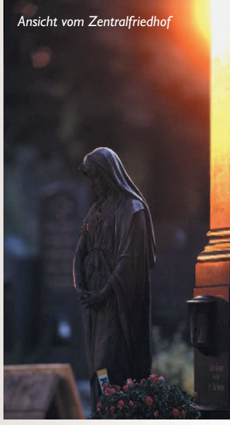
Ansicht vom Zentralfriedhof

Info und Anmeldung unter: waswannwo@nhm-wien.ac.at und Fax: (01) 521 77 / 395